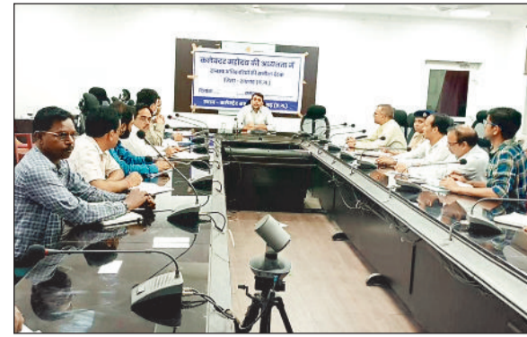
हरिभूमि न्यूज ►► रायगढ़

3 मई को आयोजित होने वाली राष्ट्रीय पात्रता सह प्रवेश परीक्षा नीट यूजी 2026 के सफल, निष्पक्ष और सुव्यवस्थित संचालन को सुनिश्चित करने के लिए बैठक आयोजित हुई। बैठक में जिले के सभी संबंधित विभागों के वरिष्ठ अधिकारी शामिल हुए और परीक्षा व्यवस्था के हर पहलू पर गहन चर्चा की गई। कलेक्टर ने कहा कि परीक्षा के आयोजन में किसी भी प्रकार की लापरवाही या समन्यव की कमी नहीं होनी चाहिए। उन्होंने अधिकारियों को समय-सिमा के भीतर सभी तैयारियां पूर्ण करने के साथ-साथ कंट्रोल रूम पर हेल्पडेस्क और आपातकालीन व्यवस्थाओं को